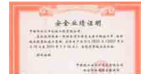
中国核工业华兴建设有限公司阳江核电项目 经理部授予我司2015大年事故安全业绩证明

中核华兴达丰有着丰富的核电项目服务管理经验，核电建设的要求苛刻程度可谓是让人望而生畏，然而中核华兴达丰却能胜任，并且获得甲方的一致认可。我们将这些核电项目的管理经验融会贯通应用到其他类型项目的服务管理上，将品质服务带给每一位客户。中核华兴达丰的四条纵向管理体系，是公司的管理主线，保证了整个公司规范而有序的运行：安全管理、设备管控、基层人力资源管理以及技术管理。全公司目前一共有35个程序文件，对公司运营的每一个细节都做出了详细规定，使得员工工作有据可循，也保证了公司规范化运作的顺利开展。中核华兴达丰在管理上的精细程度让很多客户都惊叹，他们说，“把项目交给你们，我们放心！”