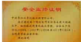
中核华兴建设有限公司宁德核电项目部授予 我司2015大年事故安全业绩证明