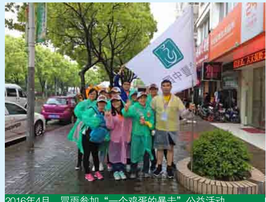
2016年4月，冒雨参加“一个鸡蛋的暴走”公益活动

来到公司印象中最深刻的一次活动是“一个鸡蛋的暴走”。从来没有参加过50公里这么远路程的暴走活动，虽然只是作为志愿者，也让我很兴奋。而且这是一次公益徒步筹款活动。从出发开始，雨就一直下，越下越大，参赛选手们的头发淋湿了，衣服也湿透了，鞋里也进水了，身体越来越沉重，可是他们仍然在一步一步地前行，第一个10Km、第二个10Km、第三个10Km……就算是天黑了他们也仍在坚持，直到抵达终点。尽管困难重重，中核华兴达丰的每一位参赛选手都坚持到了最后。那次活动让我感受到一股坚毅的力量，也感受到了中核华兴达丰人的力量。