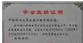
中广核工程有限公司霞浦二期项目授予 我司19145大年事故安全业绩证明