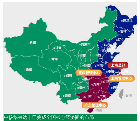
中核华兴达丰已完成全国核心经济圈的布局